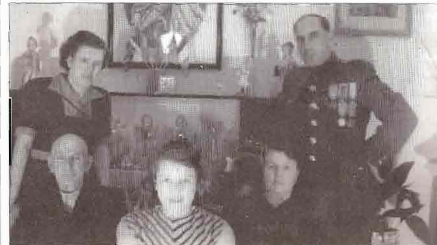
▲ Rodinná fotografie, vpravo otec, legionář.

Až teprve v roce 2007 mu kdosi navrhl, aby se ucházel o nějaký příspěvek. Jeho přítelkyně s ním žil na Mělnicku posledních dvacet let, mluví ukazuje dopis od Česko-německého fondu budoucnosti z 31. ledna 2007, že mu byla přiznána platba z prostředků nadace. „Prokázal v době druhé světové války“, píše se v tom dopisu, „odvahu a odpovědnost o budoucnost své země. Otrocké práce, jež musel vykonávat pro národní socialistický režim v době druhé světové války se mu podařilo opustit a uprchnout...“ Odkud však od té doby žádná koruna nepřišla, můj přítel zestárl, jeho zdraví bylo čím dál chatrnější, ale humor ho nikdy neopouštěl. Říkal mi: „Přežil jsem všechny režimy od Masaryka přes Husáka až po Klause - to je oblouk, vid!“ Naučil se pracovat, poznávat lidi, nacházet mezi nimi své přátele. Jako mnoho jiných jeho kamarádů