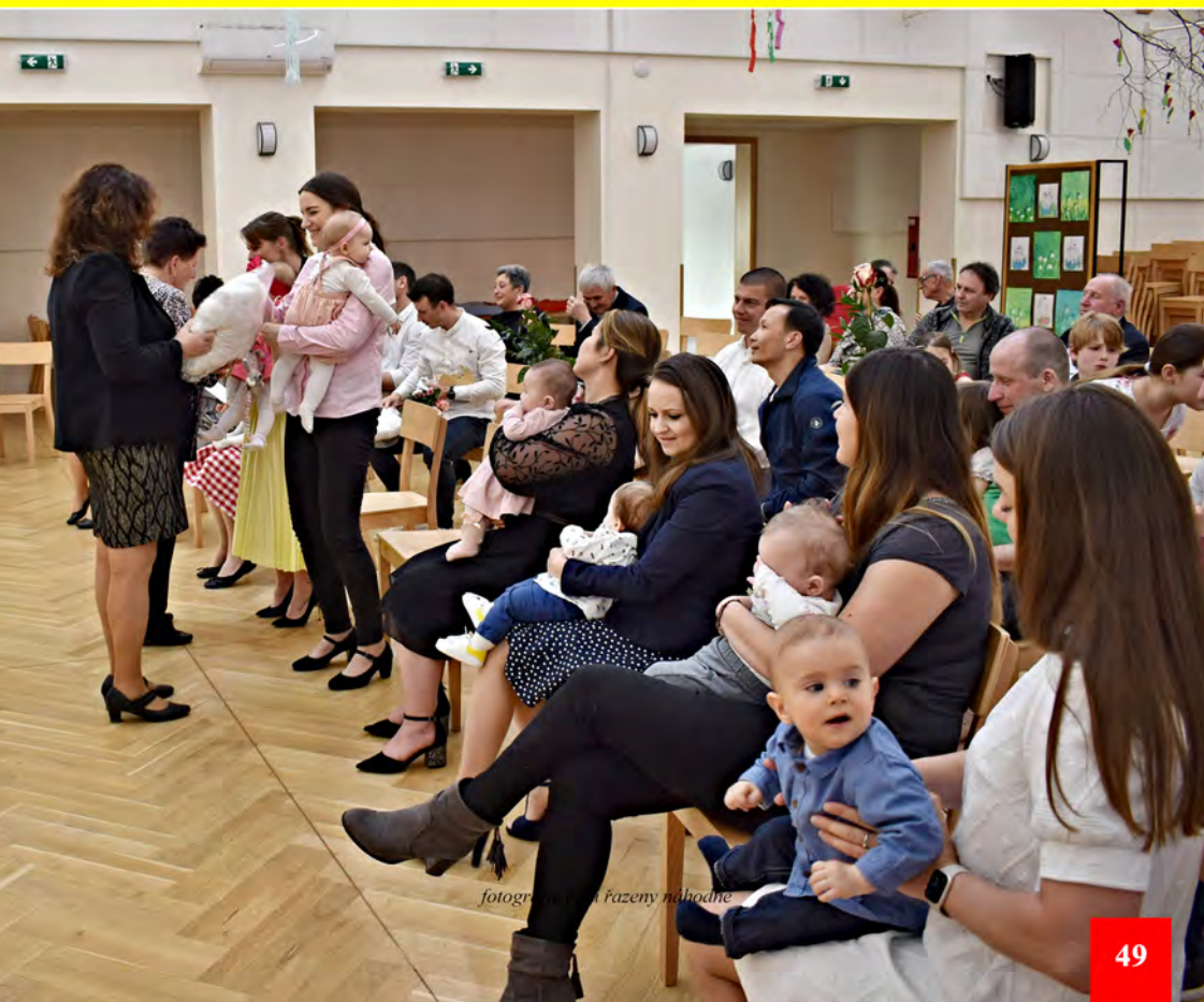
fotografujeme ženy náhodne