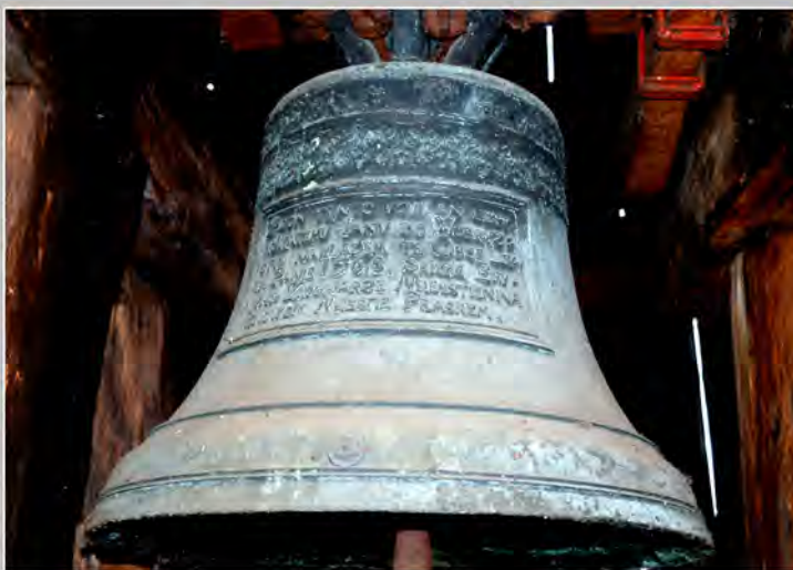
fotografie: archiv RNDr. Aleš Střecha: Zvony ve zvonici u kostela v Obříství

https://commons.wikimedia.org/wiki/File:Zvonce_prid_kostolom_zamek_Obriestvi_Skupina_Cecha_12_Obriestvi_oke_Alibik_Sitobalsky_krog